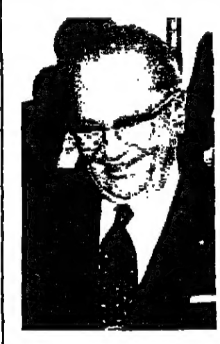
وكان العالم كله بالنسبة « لفتو » هو وضوح بوجوسلافيا الدقيق والجرح على خط التماس الجغرافي والسياسي بين موسكو وواشنطن